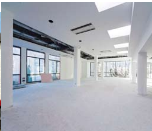
photos - Ludovic Laporte/CABA. Visuel de l'architecte - Basaltarchitecture architectes