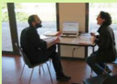
Le SIVU Auze Ouest-Cantal pense que tout devrait bien se passer !!

AU_MACA_ZH1 (Zones humides prioritaires). Cette mesure vise à maintenir le bon état des zones humides abritant des habitats d'intérêt communautaire fragiles. Les principaux engagements sont une absence de fertilisation, une limitation de la pression de pâturage, un retard du pâturage/fauche après le 20 juin (80 jours de retard).